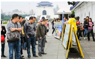
臺北自由廣場，大陸遊客 在認真看法輪功真相展板