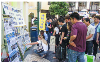
在澳門議事亭前 看真相的大陸遊客

1999年，江澤民曾狂妄地叫囂「三個月消滅法輪功」，如今十九年過去了，法輪功不但沒有被消滅，卻有更多的有緣人修煉法輪功。面對著中共的強權暴力迫害，法輪功學員始終如一地遵循著「真、善、忍」的原則，和平理性地向民眾講清真相，揭露中共的邪惡迫害，贏得了世界各國人民的讚譽。加拿大前總理哈珀讚揚說：「過去的二十多年間，全世界有無數的人受益於修煉法輪大法。」現在，越來越多的中國大陸民眾也明白了真相，為自己選擇了美好的未來。