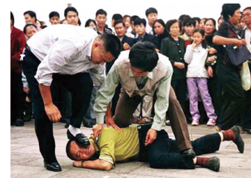
中共警察非法抓捕法輪功學員

1999年7月20日開始，江澤民集團開動全部國家機器，動用了古今中外一切邪惡手段，開始了長達十多年的對法輪功的迫害。中共迫害法輪功學員所動用的酷刑達百種之多。