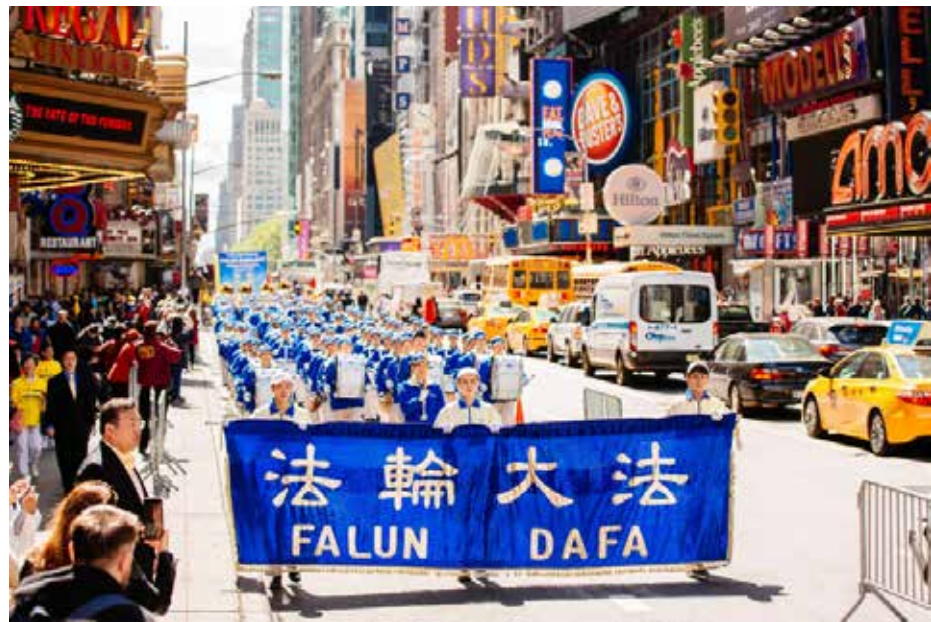
图：2017年5月，曼哈顿万人游行，庆祝法轮大法弘传世界25周年。