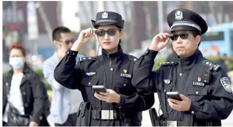
▲警察使用具有人脸识别功能的墨镜

正常的国家，是运用最新的技术造福于人民，而中共的逻辑从来都是反过来的，是用最新的技术监控、压制国民，宁可民生民用亏空，也要不计后果打造警察国家。