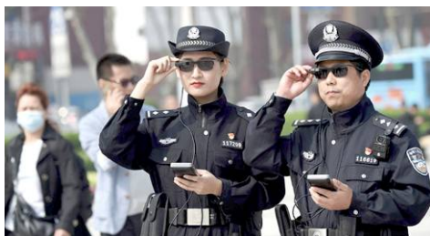
▲警察使用具有人脸识别功能的墨镜

正常的国家，是运用最新的技术造福于人民，而中共的逻辑从来都是反过来的，是用最新的技术监控、压制国民，宁可民生民用亏空，也要不计后果打造警察国家。