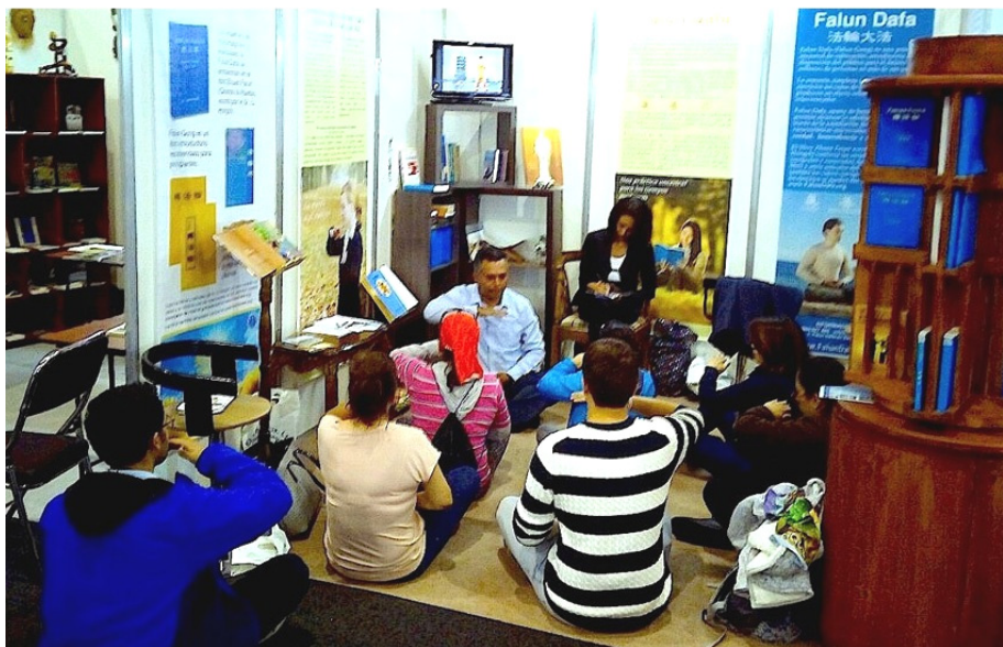
■在书展上，络绎不绝的人群来到法轮功展台参观学炼功法

来到法轮功展台，炼完功后，他告诉学员：“我过来的时候，就看见法轮功展台有能量在转动，这种机会可遇而不可求，所以我马上学炼功法。我近几年一直在寻找修炼的机缘，非常感谢你们！”