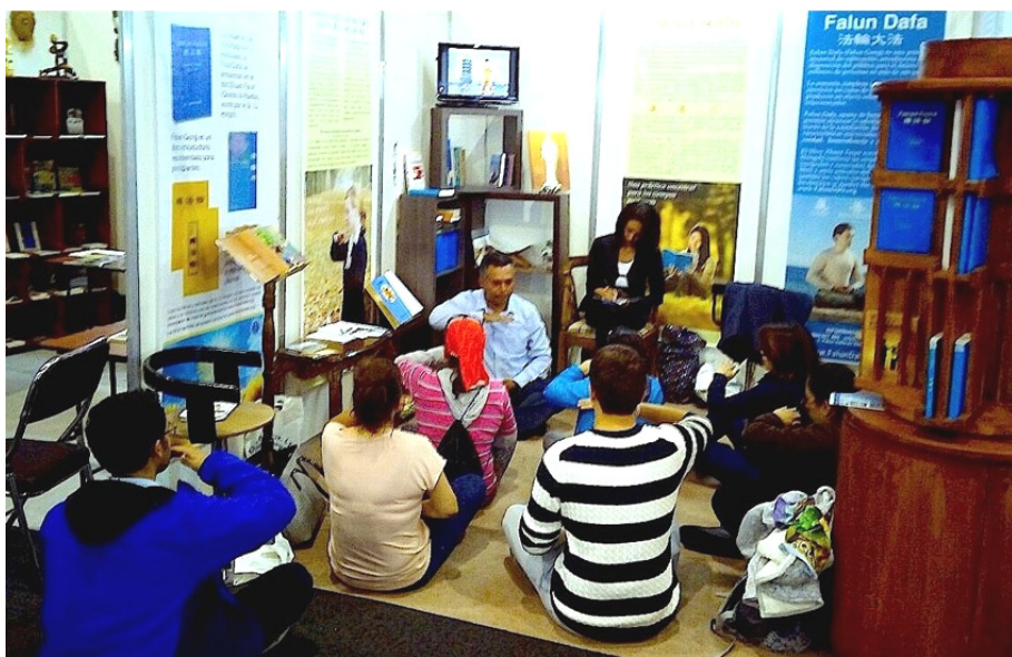
■在书展上，络绎不绝的人群来到法轮功展台参观学炼功法

来到法轮功展台，炼完功后，他告诉学员：“我过来的时候，就看见法轮功展台有能量在转动，这种机会可遇而不可求，所以我马上学炼功法。我近几年一直在寻找修炼的机缘，非常感谢你们！”