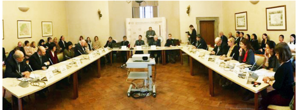
图：捷克国会参议院在瓦尔茨特荫宫馆扎翰沙龙举行了公众听证会

受到邀请的有法轮功学员代表、从事调查盗窃人体器官的工作人员、媒体、经济分析师、捷克赫尔辛基委员会成员、外交部的代表出席了听证