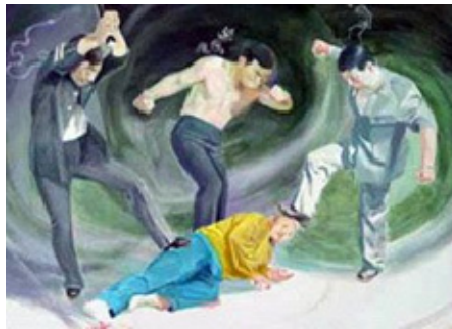
■ 中共酷刑演示：殴打

2014年7月9日，锦州市古塔区法院非法对我庭审，警察如临大敌，我被强制戴着脚镣、手铐，