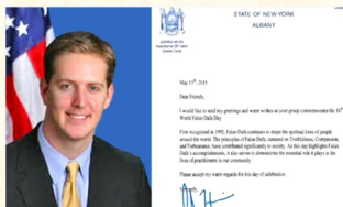
北美政要贺大法日 褒奖法轮大法