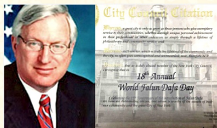
纽约市议员阿伦·梅塞尔颁发褒奖

法轮大法给人类带来了光明和希望，“真善忍”的理念和实践，深受世界各族裔民众的喜爱。迄今，法轮大法得到全球各界有识之士的赞赏与珍视，很多人纷纷走入修炼。北美、欧洲、亚洲、澳洲等地各级政府、议会，为法轮功颁奖并高度推崇法轮功在提升道德、净化人心、强身健体与福国利民方面的卓越成果。