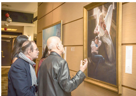
▲著名画家阿格罗斯（右）和迪米特里斯·瓦尔瓦雷索斯（左）在艺术展上欣赏画作《流离失所》。

另一位著名画家迪米特里斯·瓦尔瓦雷索斯（Dimitris Varvaresos），在看到其中一幅画作——小女孩抱着父母的骨灰泪流满面时，他说：这些艺术家从神圣中获取灵感。