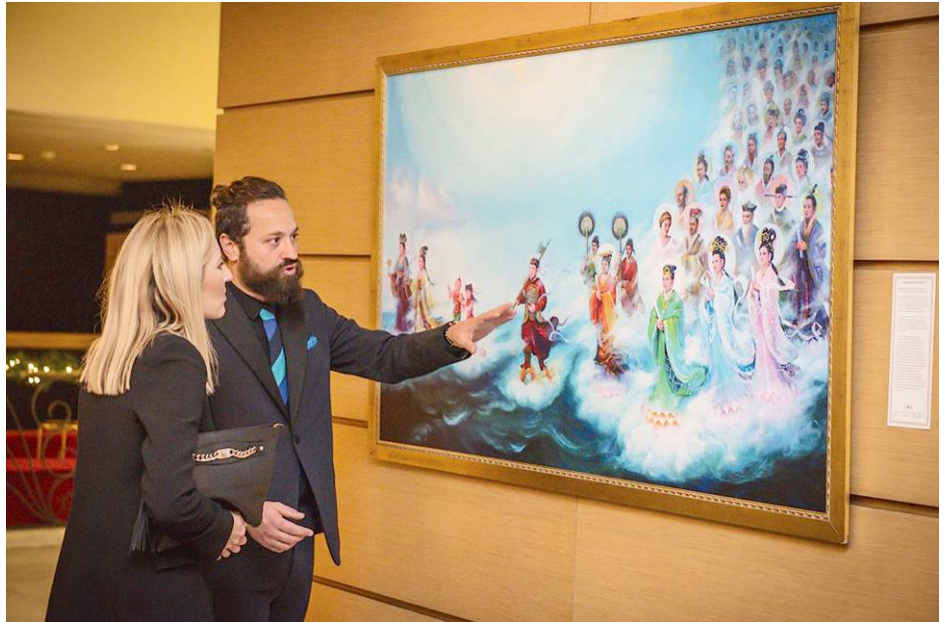
▲法轮功学员在艺术展上为参观者讲解画作《誓约》。