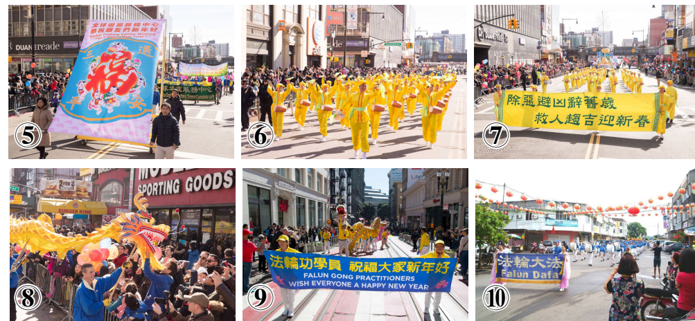
④—⑨美国纽约、旧金山法轮功学员庆祝中国新年大游行。⑩马来西亚法轮功学员庆祝中国新年大游行。