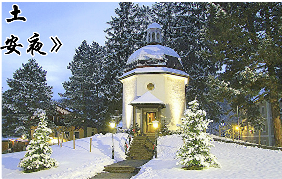
▲1937年，人们在首次演唱《平安夜》的教堂原址，修建了一座新的教堂——平安夜教堂，以纪念这首歌的诞生。