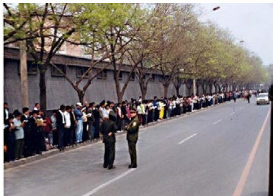
※ “4·25”上访现场。法轮功学员安静有序，警察在悠闲地聊天。