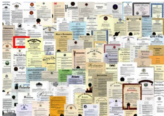
✿ 法轮大法获得各界褒奖、支持议案和支持信函 3600 多项。

北美、欧洲、亚洲、澳洲等地各级政府、议会，颁奖并高度推崇法轮功在提升道德、净化人心、强身健体与福国利民方面的卓越成果。