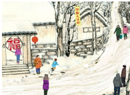
※ 三姨不仅生活能自理了，还去二十里外的女儿家串门。