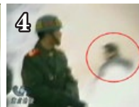
凶手刚用过力的姿势