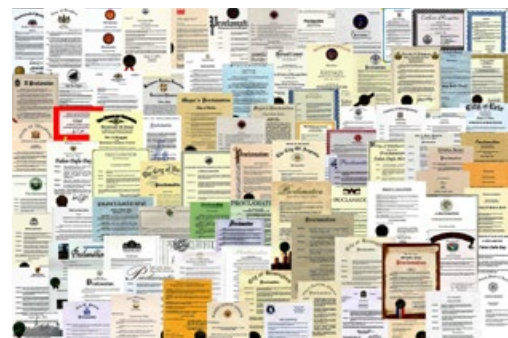
法轮大法获得各国各界褒奖、支持议案和支持信函3600多项。

北美、欧洲、亚洲、澳洲等地各级政府、议会，颁奖并高度推崇法轮功在提升道德、净化人心、强身健体与福国利民方面的卓越成果。