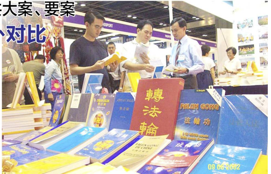
▲2002 年的年度世界书展在新加坡举行，图为展位中的《转法轮》。