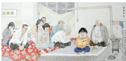
▲绘画：村民一起读法轮功书籍

据悉便衣警察对这几位法轮功学员家蹲坑监视了一段时间，把他们聚集读书的行为定为“大案”、“要案”，中央督查组、山西省公安厅、太原市公安局联合办案。