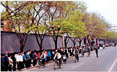
图: 1999年4月25日，万名法轮功学员到北京和平上访图片。

在西方社会，人们把除宗教、商业外的社会活动都视为政治活动，参与政治是公民的正当权利。而中共把“政治”