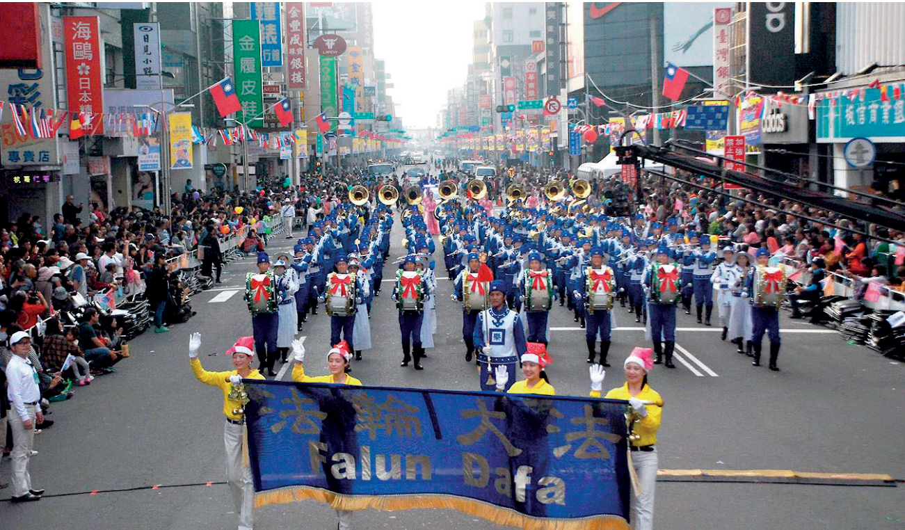
图:2019年12月21日，一年一度的国际管乐节在台湾嘉义市揭幕，法轮大法天国乐团与来自日本、法国、德国、比利时、泰国、香港及台湾等的五十组队伍参加开幕游行，受到民众热烈欢迎。