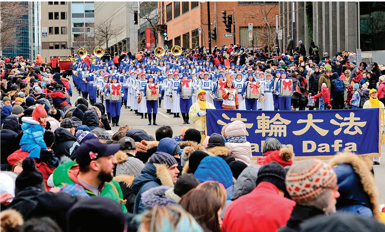
图:2019年11月23日，法轮大法天国乐团受邀参加加拿大蒙特利尔圣诞大游行庆祝活动。