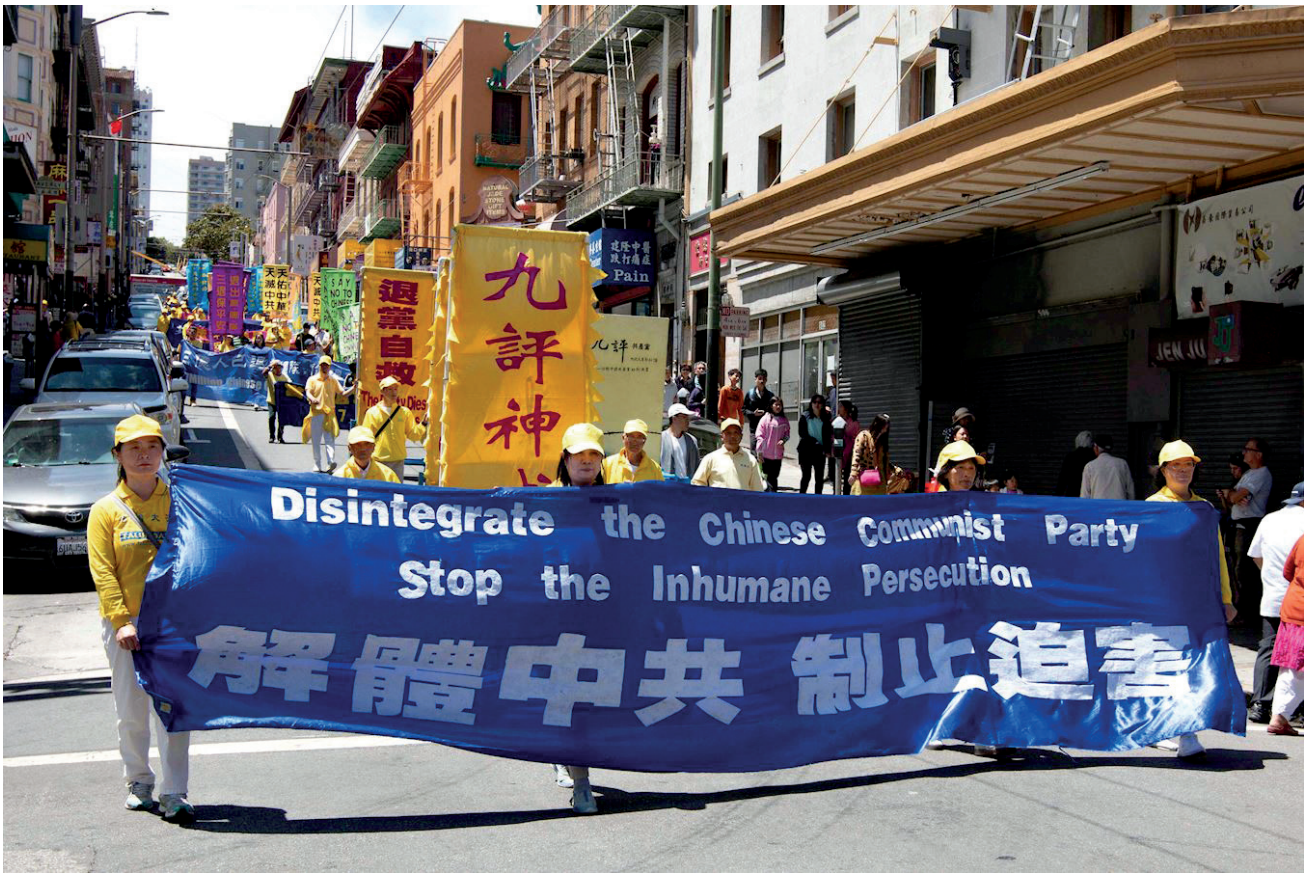
图：2019年7月20日，美国旧金山举行盛大游行，呼吁制止对法轮功持续20年的迫害，声援三亿多中国同胞三退（退出中共党、团、队）。

父救度我！”听到这句话，我眼泪一下子流出来了，被震撼了。他也看着我，他的眼睛也湿润了。我内心无法平静，即时无语了，挥手和他再见。他一边离去，一边挥手，一边回头看我。