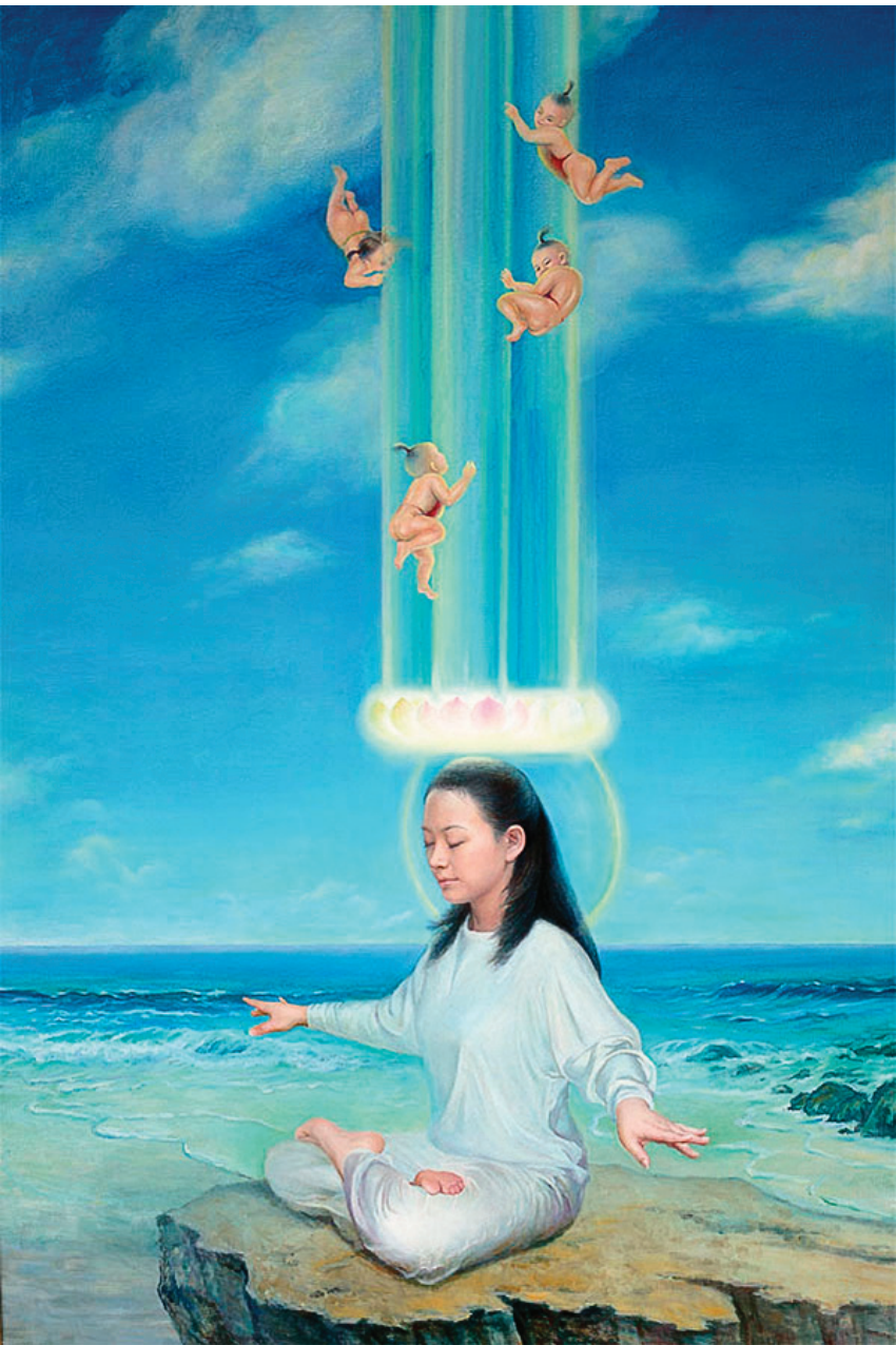
“真善忍美展”作品：〈天人合一〉。