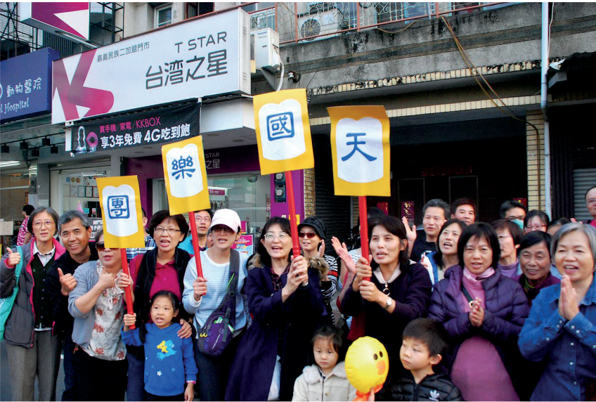
图:一群嘉义市民在民族路上兴奋地举着写着“天国乐团”的广告牌欢迎天国乐团。

光。全程近三公里，沿路万人空巷，围观的群众望着天国乐团鼓掌欢呼：“这是最壮观的乐团。”