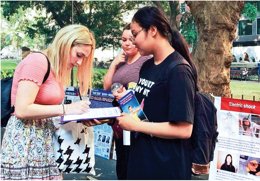
图:民众了解真相之后，许多人签署给澳洲政府的请愿书，支持法轮功反迫害。

此征签旨在呼吁澳洲总理、外交部长和澳洲政府帮助停止中共对法轮功长达二十年的残酷迫害；停止中共强摘法轮功学员及良心犯的器官；拒发参与迫害法轮功的中国官员和警察的签证。