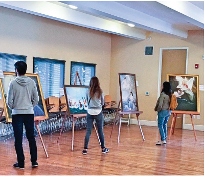
图:观看展览的人络绎不绝。

在中国求学六年，在中国时听说过法轮功，但是看了画展才了解法轮功受到了这样的迫害，当他了解到当天的展品只是全部画展作品中的一部份时（空间有限），立刻表示渴望还能看到其他的画卷，并留下了联系方式给主办方。