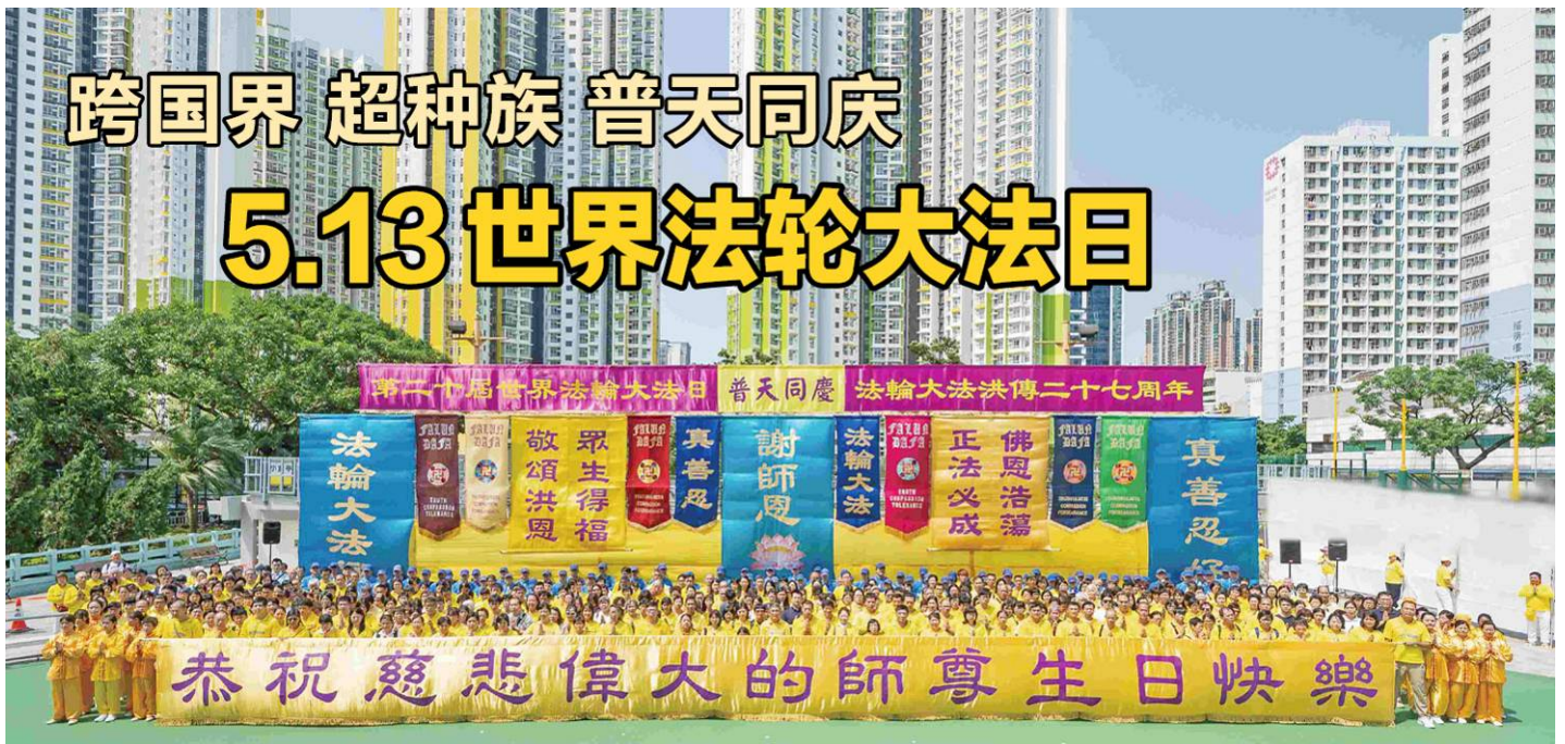
▲5月12日，香港法轮功学员举办盛大的集会游行，敬谢师恩，并向民众传扬“法轮大法好，真善忍好”的福音。