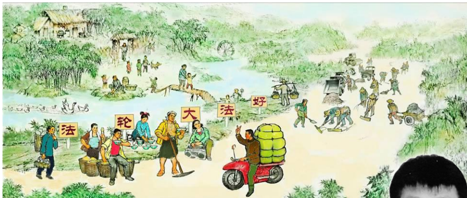
▲绘画：法轮功学员出钱出力，义务为村民修路。

截至2019年4月底在海外退党网站声明“三退”（退党、退团、退队）的人数已超过3.31亿。