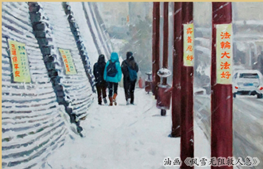
油画《风雪无阻救人急》