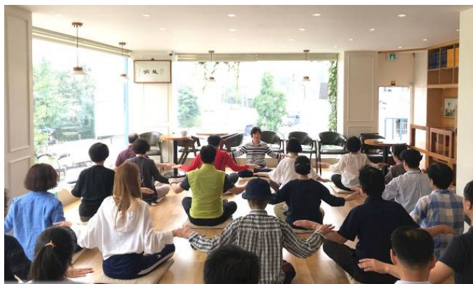
▲新入门的学员在学炼法轮功第五套功法

出路时，遇到了法轮功。参加了九天班后，她激动的说：“真是找对了功法啊，我决心用尽自己的一生坚持修炼法轮功。”