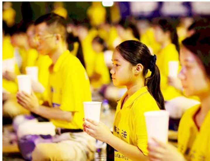
2019年7月20日，台湾法轮功学员纪念反迫害20周年。

最残暴的专制政权，法轮功经受住了这个政权用全部国家机器的灭绝性打压，法轮功是打不倒的。