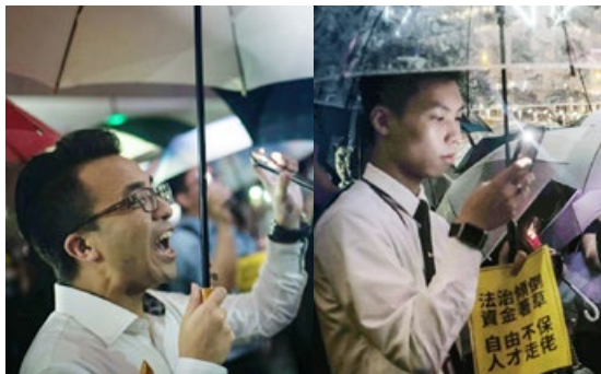
香港金融界人士，8 月 1 日晚集会，人们手持 “法治倾倒，自由不保”标语，高呼“香港 人加油”、“没有暴徒只有暴政”口号。