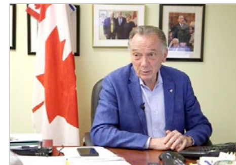
加拿大国会议员彼得·肯特：制裁人权迫害者，加拿大应比美国做得更多。

目前全球 28 个国家已经制定或准备制定类似于美国的《马格尼茨基法案》，对人权迫害者拒发签证、冻结海外资产。◇