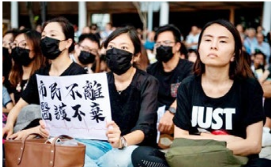
香港医疗界人士 8 月 2 日集会表达心声： 市民不离，医护不弃；坚守信念，紧守良知。