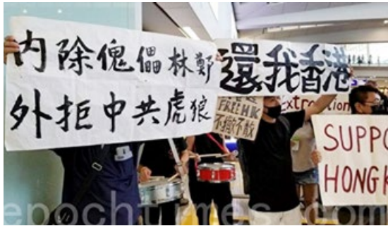
香港航空界职员 7 月 26 日集会，横幅： 内除傀儡林郑，外拒中共虎狼。还我香港。