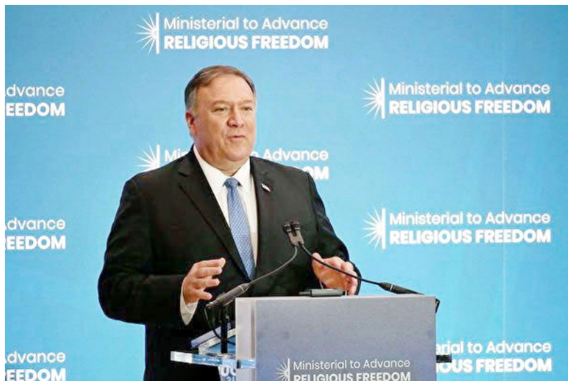
美国国务卿蓬佩奥，2019 年 7 月 16 日在国务院宗教自由会议上发言。

设计完成过重大军工电子产品。马振宇坚持修炼法轮功，多次遭监禁和酷刑，累计坐牢七年多。