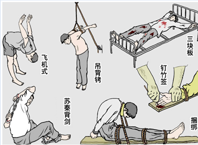
中共酷刑图示（部分）

法轮功学员认为，很多“公检法”人员是被中共的仇恨宣传欺骗，才参与这场迫害，他们与所有被中共欺骗的人都是受害者。这也是法轮功学员一直致力于向中国民众和国际社会讲真相的原因，他们希望人们能知道法轮功教人向善的真相和中共迫害的事实。◇