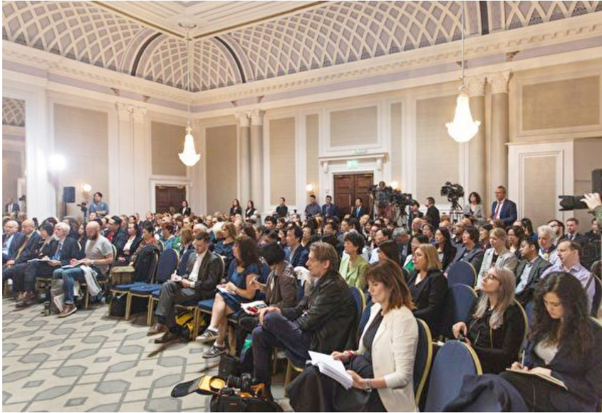
独立人民法庭在伦敦宣判，法庭内聚集了大约 200 名旁听民众和记者。