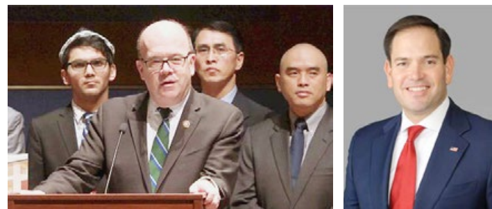
美国国会及行政当局中国委员会（CECC）主席麦高文议员（中）