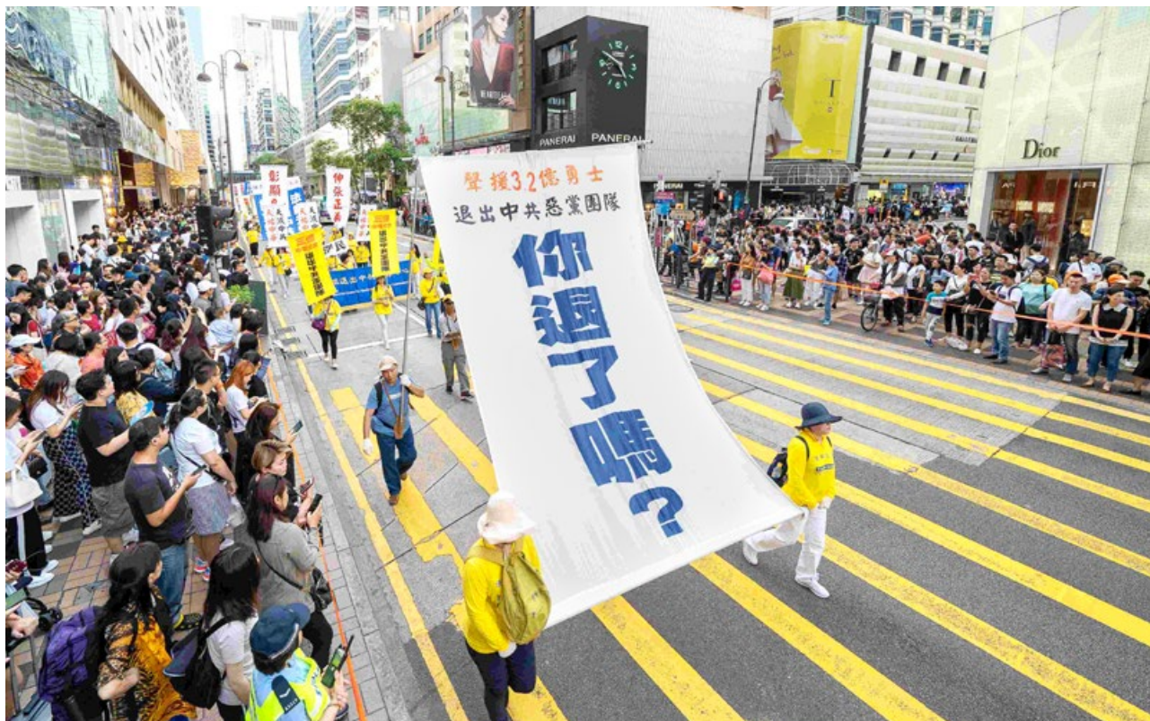
2019年5月12日，香港法轮功学员大游行，传递真相信息。