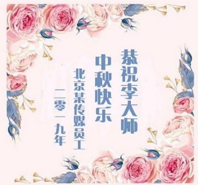
▲北京某传媒员工中秋贺卡

我们员工中,有结婚数年没有孩子,因为退出中共党团组织后,喜得贵子的;有家属出差在宾馆触电,默念“法轮大法好”遇难呈祥的;有出车遇到劫匪,默念“法轮大法好”平安无事的;有采访夜归,遇到抢手机的,默念“法轮大法好”劫匪吓跑的;有刹车失灵,默念“法轮大法