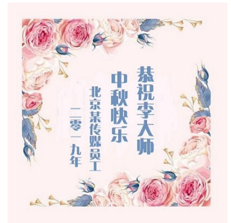
▲北京某传媒员工中秋贺卡

我们员工中,有结婚数年没有孩子,因为退出中共党团组织后,喜得贵子的;有家属出差在宾馆触电,默念“法轮大法好”遇难呈祥的;有出车遇到劫匪,默念“法轮大法好”平安无事的;有采访夜归,遇到抢手机的,默念“法轮大法好”劫匪吓跑的;有刹车失灵,默念“法轮大法