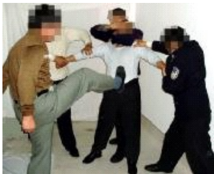
▲酷刑演示：拳打脚踢

九月二十四日下午，鸡东县东风派出所两警察到高姓老年法轮功学员家骚扰，当时在场的还有两名老年法轮功学员。