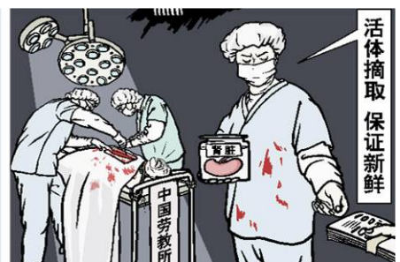
时事漫画：罪恶的交易