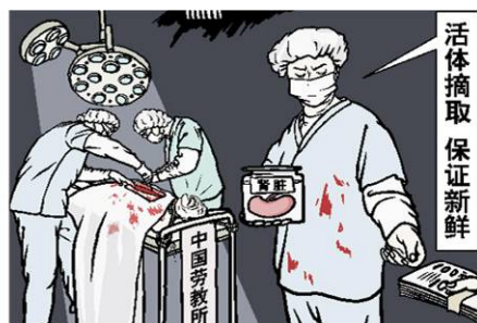
时事漫画：罪恶的交易