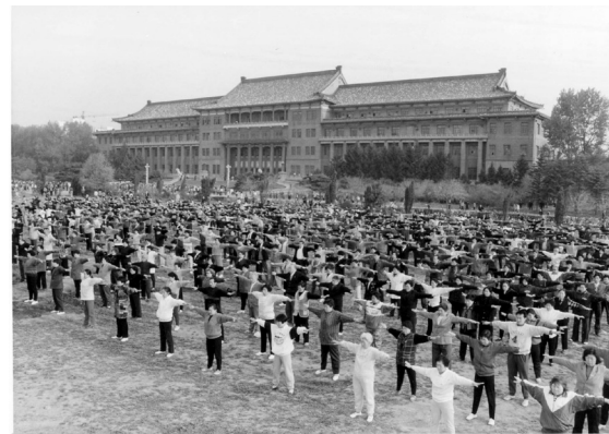
1999年7月前长春法轮功学员在长春地质宫广场上集体炼功

就在这个时候，她突然想起了在医院住院的时候，有一个朋友曾经给她推荐法轮功。1997年，当时法轮功在国内包括在长春市已经有很多人开始炼了，她也知道。只是她觉得炼法轮功好像是父母那个年龄的人要做的东西。另一方面，她对医生所有的治疗方案还是充满了信心，