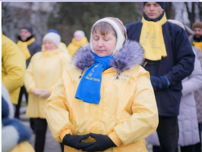
▲正在炼功中的法轮功学员

一位体育教练带着五名学生经过弘法活动旁，以法轮功学员集体炼功为背景拍照留念。学员走上前告诉他们：“你们知道这可是历史性的时刻，你们的照片将会永远记载这历史时刻。”当他们与学员交谈得知“真善忍”是法轮功的基本原则，体育教练赞同地说：“是，真善忍确实是人应该相信的最高原则。”