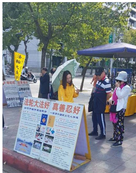
▲法轮功学员在台北国父纪念馆园区内摆展板，讲真相。

的男士，独自脱队来到了真相点旁抽烟，全神贯注仔细地看完了“四二五和平正义上访”、“天安门自焚伪案”展板，对学员说，“现在知道了，终于明白了！”原来他沿