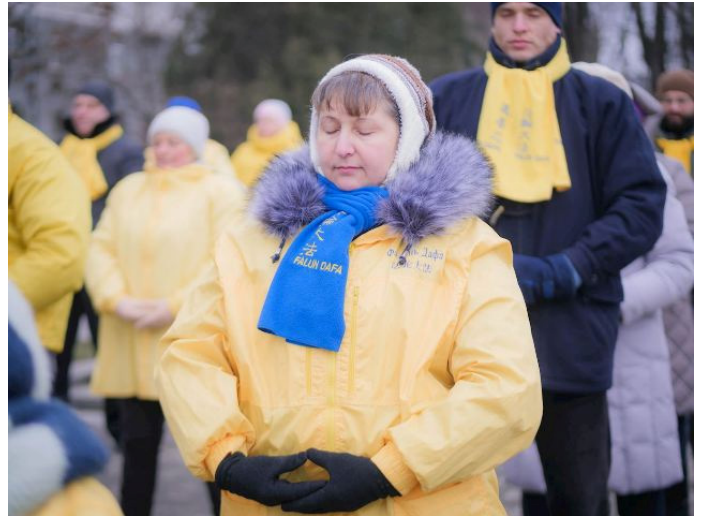
▲正在炼功中的法轮功学员

一位体育教练带着五名学生经过弘法活动旁，以法轮功学员集体炼功为背景拍照留念。学员走上前告诉他们：“你们知道这可是历史性的时刻，你们的照片将会永远记载这历史时刻。”当他们与学员交谈得知“真善忍”是法轮功的基本原则，体育教练赞同地说：“是，真善忍确实是人应该相信的最高原则。”