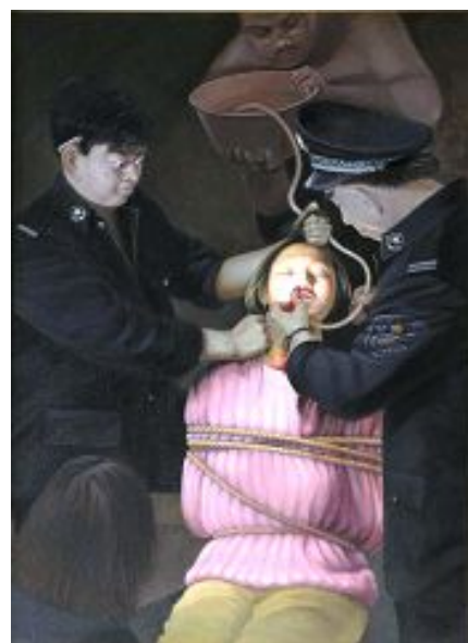
▲酷刑演示：野蛮灌食（绘画）

2017年，根据明慧网不完全统计，吉林省法轮功学员至少有42,388人次遭到不同程度的迫害，其中被迫害致死的至少463人，非法判刑至少1,171人次，非法劳教至少10,158人次，强制洗脑至少3,620人次，被绑架的至少24,548人次。◇