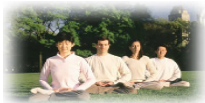
善良无罪 修炼无罪