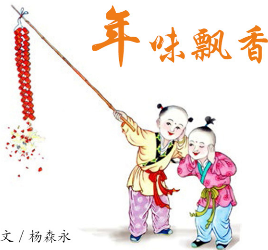
文 / 杨森永

孩提时期最丰满的记忆中，最期盼的就是过年了，因为那样就可以有新衣服穿，有肉吃，还可以不用担心到处玩了以后被骂，更不用