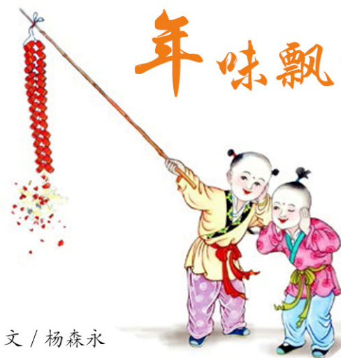
文 / 杨森永

孩提时期最丰满的记忆中，最期盼的就是过年了，因为那样就可以有新衣服穿，有肉吃，还可以不用担心到处玩了以后被骂，更不用