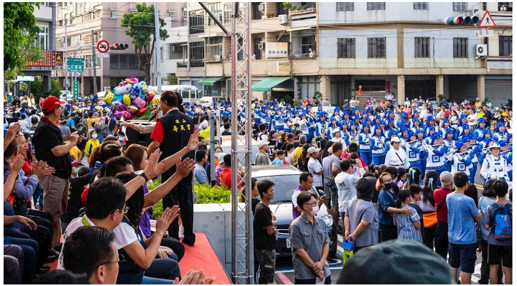
▲气势磅礴的法轮功天国乐团浩浩荡荡穿行冈山热闹市，经过主席台时，很多政要挥手致意，沿途吸引不少民众观看、比赞和拍照。

中共是“反人性、反自然”的政治流氓集团，它钳制信仰自由，戕害基本人权，给所有华夏子民带来了无尽的苦难。国际社会一再呼吁中共尊重信仰自由，然而面对邪灵本性的中共，解体中共才是彻底解救之道。◇