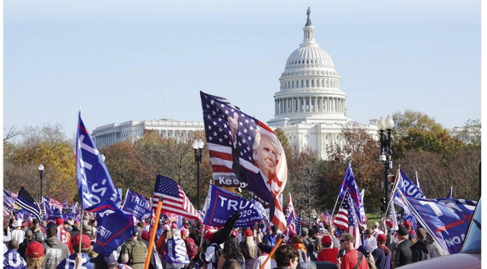
▲2020 年 11 月 14 日，数十万民众来到首都华盛顿参加支持川普总统的大游行。

泱泱大国，舞弊乱象，令人匪夷所思，不但重创了自由世界引以为傲的宪政民主、践踏了人类文明和道德底线，更预兆着美国面临危急的未来：左派代理人倘若真的“窃取”了美国大选，美国和世界将被邪恶社会主义侵蚀并拖入深渊。