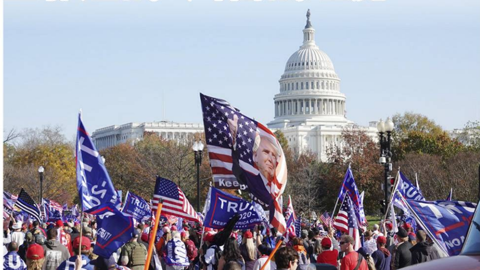
▲2020 年 11 月 14 日，数十万民众来到首都华盛顿参加支持川普总统的大游行。

泱泱大国，舞弊乱象，令人匪夷所思，不但重创了自由世界引以为傲的宪政民主、践踏了人类文明和道德底线，更预兆着美国面临危急的未来：左派代理人倘若真的“窃取”了美国大选，美国和世界将被邪恶社会主义侵蚀并拖入深渊。