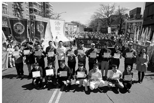
纽约华人公开宣布退出中共党、团、队，并领取由全球退党服务中心颁发的“退党（团、队）证书”

外国的月亮比中（共）国的圆，并非真理，却是真相。西方的民主、自由、信仰，人权与法制，人与环境的和谐发展，始终是吸引国内民众的重要因素。即便是在中共国际形象越来越差，遭遇国际围堵的当下，留学、移民热潮仍持续澎湃，人们对西方自由社会趋之若鹜。