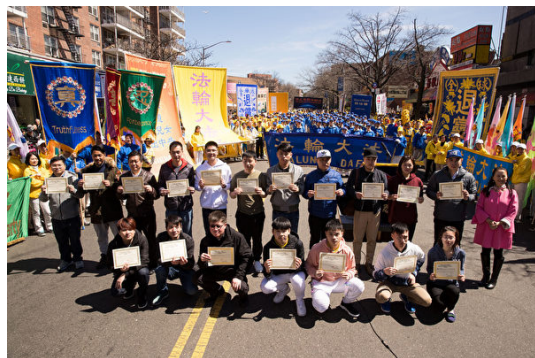
纽约华人公开宣布退出中共党、团、队，并领取由全球退党服务中心颁发的“退党（团、队）证书”

外国的月亮比中（共）国的圆，并非真理，却是真相。西方的民主、自由、信仰，人权与法制，人与环境的和谐发展，始终是吸引国内民众的重要因素。即便是在中共国际形象越来越差，遭遇国际围堵的当下，留学、移民热潮仍持续澎湃，人们对西方自由社会趋之若鹜。