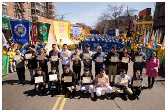
纽约华人公开宣布退出中共党、团、队，并领取由全球退党服务中心颁发的“退党（团、队）证书”

外国的月亮比中（共）国的圆，并非真理，却是真相。西方的民主、自由、信仰，人权与法制，人与环境的和谐发展，始终是吸引国内民众的重要因素。即便是在中共国际形象越来越差，遭遇国际围堵的当下，留学、移民热潮仍持续澎湃，人们对西方自由社会趋之若鹜。