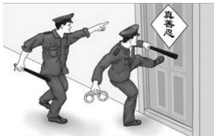
▲漫画：中共警察闯入民宅绑架法轮功学员