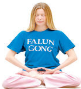
信仰合法 迫害有罪