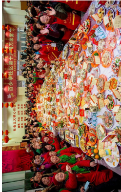
曾经的百步亭“万家宴”

疫情爆发期间，武汉百步亭社区因相信政府说疫情可控，照样摆了“万家宴”。目前百步亭社区感染严重，2月9号，绝望的居民在网上求救并曝光，说当局掩盖疫情真相，直接放弃了百步亭，没有物资发放。