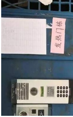
如今的百步亭社区发热楼栋