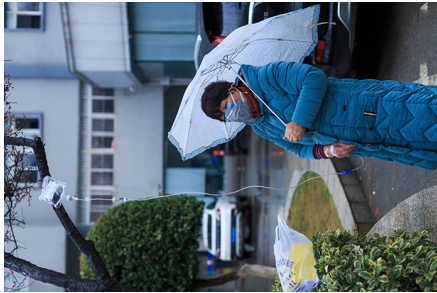
汉阳医院，无处可去的患者在路边打吊瓶。