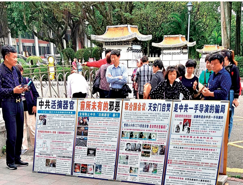
图：法轮功学员在台北国父纪念馆园区内传播真相，图为大陆游客阅读法轮功真相展板。

心底希望也能享有的体制与生活。如果共产党来了，你们什么都没了！”这位善良的老先生一一将展板全部录了像，说：“回去给儿子看！我儿子也不信共产党！”