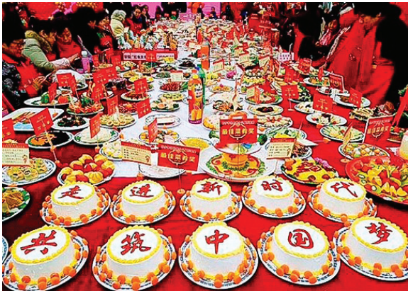
图: 武汉百步亭万家宴中，一些油麻地歌颂中共的主题菜被高调展出。

万家宴中，一些歌颂中共的主题菜被高调展出，其中包括“庆祝新中国成立 70 周年”主题菜、“武汉军运会赛事