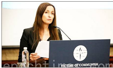
▲终止中共移植滥用国际联盟执行主任苏西·休斯（Susie Hughes）

华府“共产主义受难者基金会”3月10日发布最新中共强摘人体器官研究报告。终止中国滥用移植国际联盟执行主任休斯，受邀参加这一活动。休斯在发言中说，“最近发生在中国的双肺移植，令