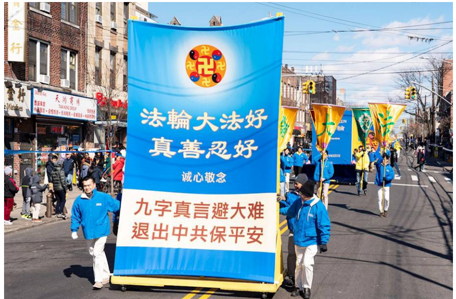
游行中的巨型横幅引人注目