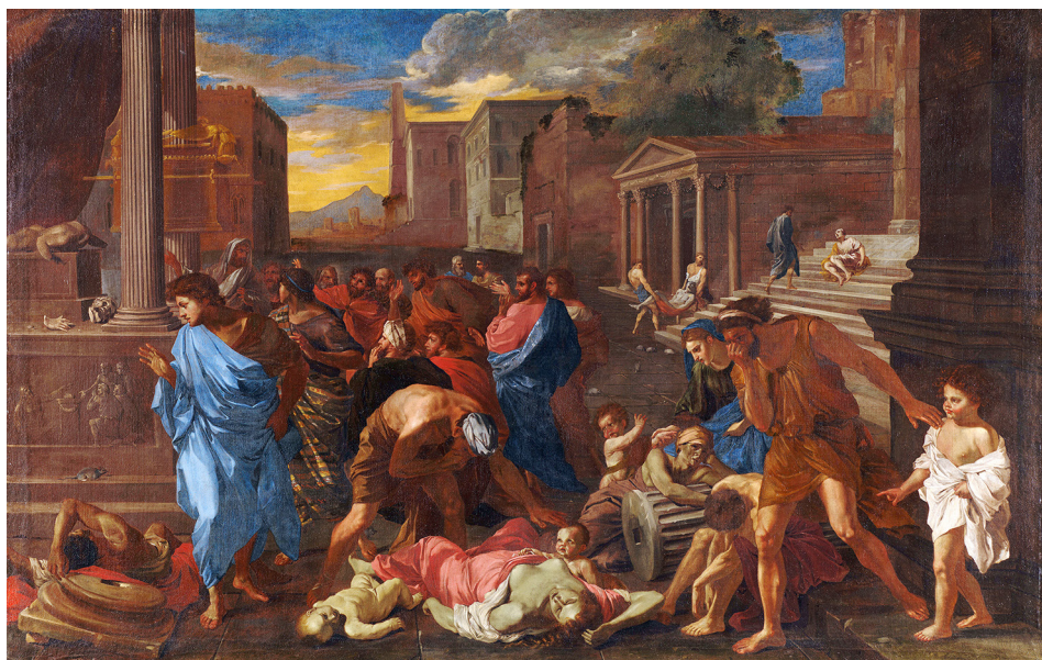
《阿什杜德的瘟疫》(The Plague at Ashdod)，油画，1630年，尼古拉斯·普桑(Nicolas Poussin, 1594-1665年)，法国。