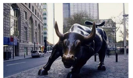
疫情中空荡荡的华尔街

武汉肺炎冲着中共而来，所有亲共国家和个人都会遭殃。杜绝中共，才能根除疫情继续蔓延。