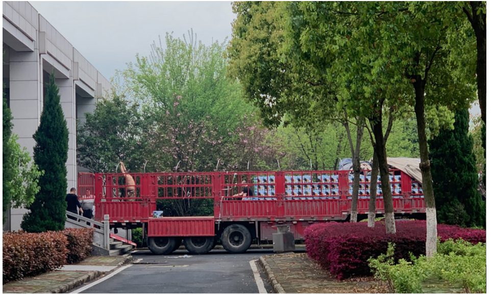
2020年3月26日下午，一辆大货车停在汉口殡仪馆静雅厅西侧门口，车上装载的是殡仪馆订购的骨灰盒。司机表示，这一车装了2500多个，已经来过卸过同样数量的一车了。

武汉七八家殡仪馆二月份日夜加班。保守估计，武汉市二月份死亡至少4万，1~3月死亡超过10万。