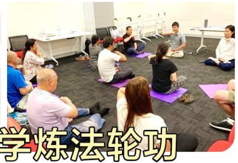
▲新学员在学炼法轮功