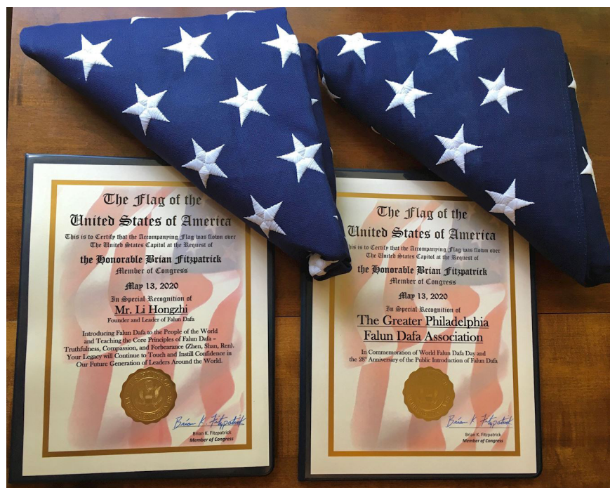
菲茨帕特里克议员办公室将“5·13”在美国国会大厦上空飘扬过的两面国旗和褒奖证书赠予大费城法轮大法学会。