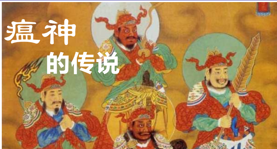
▲ 明代万历水陆画 瘟神（局部）