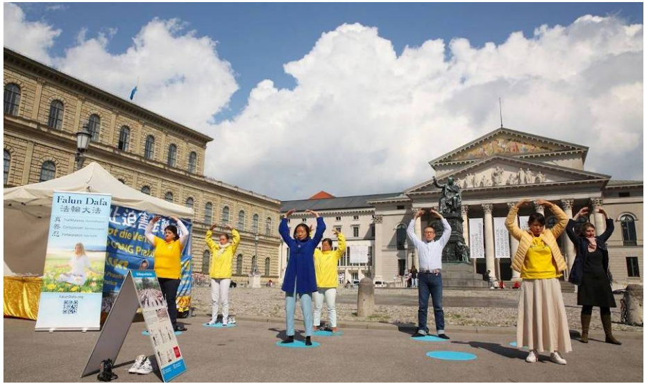
▲二零二零年五月二十八日，德国慕尼黑法轮功学员在马克西—约瑟夫广场（Max-Joseph Platz）展示功法，传播法轮功的真相。

“这个（中共活摘法轮功学员器官）事情是真的吗？为什么我们都不知道？”一位长者问道。法轮功学员给她举了一个例子：当年在达豪集中营迫害死那么多人，达豪镇上的民众对发生在眼皮底下的事情都不知情（达豪集中营就在慕尼黑附近）。她马上就听明白了，点头称是。