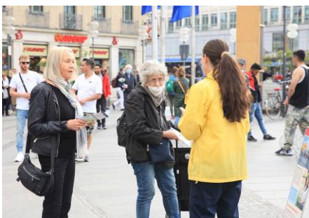
▲民众与法轮功学员交谈

一位穿着高雅的德国中年妇女看到有关中共活摘法轮功学员器官的介绍，感到不可思议，特别是当她听到中共不打麻药、直接活摘法轮功学员器官时，震惊不已，她说简直不敢相信，中共太残暴了。之后，她索取了相关资料进一步了解。